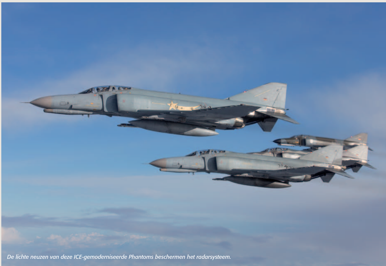
De lichte neuzen van deze ICE-gemoderniseerde Phantoms beschermen het radarsysteem.

De F-4F werd door de duale rol door zowel Jagdgeschwaders (voor de luchtverdediging) als Jagdbombengeschwaders (voor grondaanvalmissies) gebruikt. In totaal hebben zes eenheden met de Phantom gevlogen.