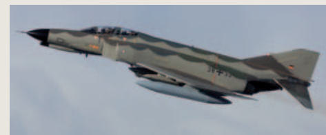
Luftwaffe Norm 81A: het 'Graue Maus' (Grijze Muis) kleurenschema.