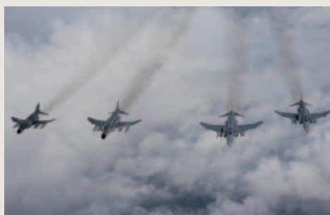
Een formatie van vier Duitse F-4F's nadert een Amerikaans KC-135R-tankvliegtuig.

Ten behoeve van een tweede moderniseringsronde werd de Kampfwertsteigerung ('KWS' of ICE) ontwikkeld om de Phantoms tot