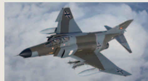
Deze tweekleurencamoufla werd Luftwaffe Norm 72 genoemd.