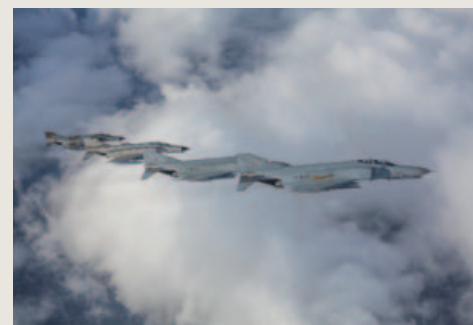
Vier JG71 'Richthofen' F-4F's. Alle drie gebruikte kleurenschema's zijn te zien.