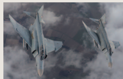
De F-4F's van JG71 zijn in Luftwaffe Norm 90J geschilderd.