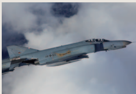
HPO in de romptekst 'Goldene HPO' is een afkorting voor 'Hourly Post-flight Inspection'.