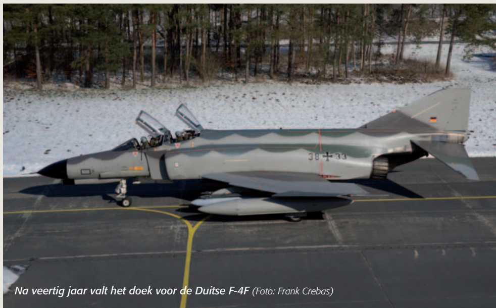
Na veertig jaar valt het doek voor de Duitse F-4F