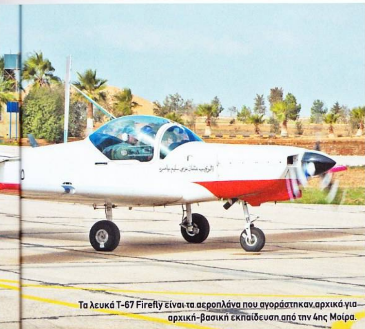
Τα λευκά T-67 Firefly είναι τα αεροπλάνα που αγοράστηκαν αρχικά για αρχική-βασική εκπαίδευση από την 4ης Μοίρα.