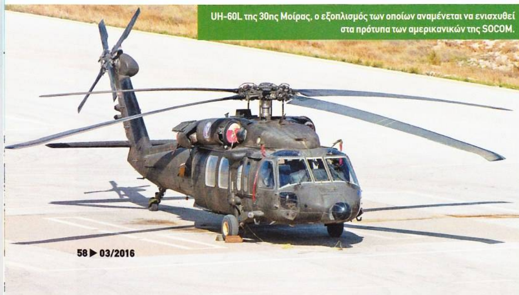
UH-60L της 30ης Μοίρας, ο εξοπλισμός των οποίων αναμένεται να ενισχυθεί στα πρότυπα των αμερικανικών της SOCOM.

Η RJAF στο πλαίσιο της κάλυψης των πολλαπλών αναγκών της σε ISR υπήρξε κατά καιρούς αποδέκτης πολλών διαφορετικών σχετικών πλατφορμών. Ανάμεσα σε αυτές που διατηρούνται σε υπηρεσία είναι δέκα Schiebel Camcop-