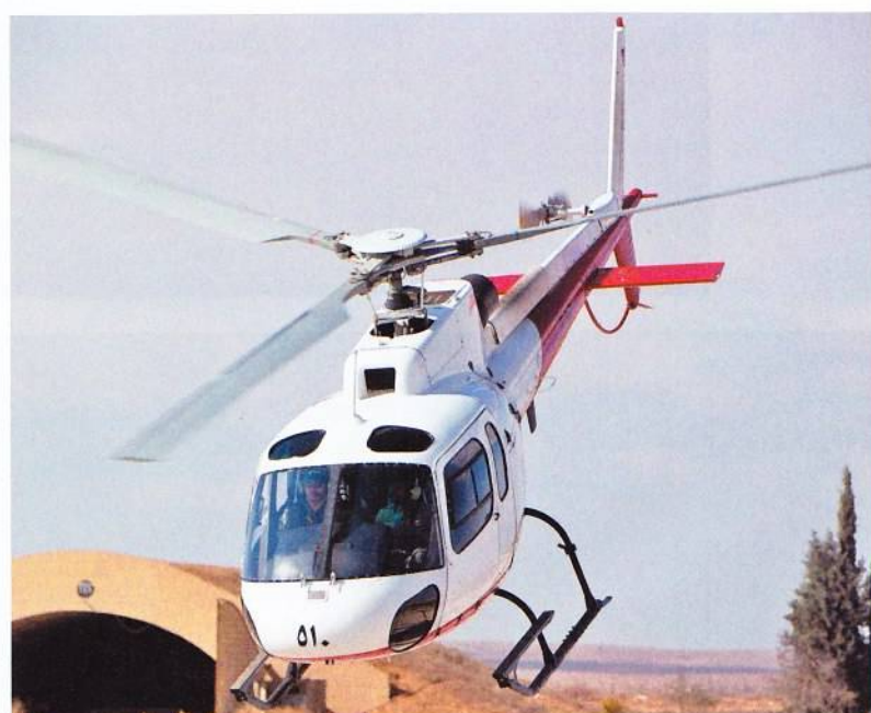
Τα AS350B3 Squirrel της 5ης Μοίρας χρησιμοποιούνται αποκλειστικά για προετοιμασία και πιστοποίηση εκπαιδευτών.