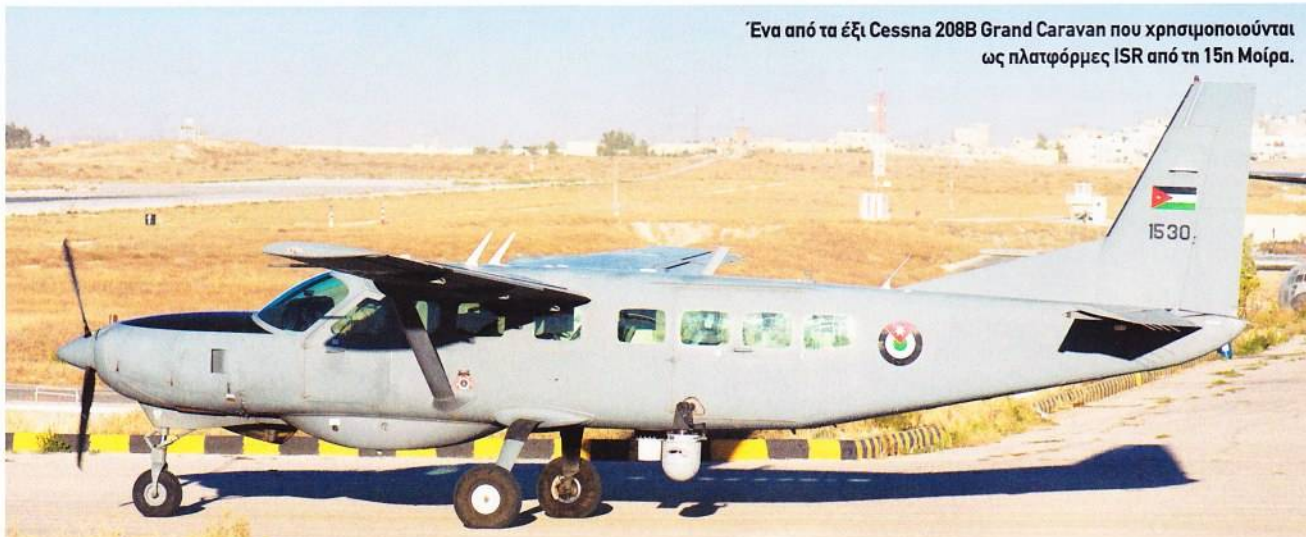
Ένα από τα έξι Cessna 208B Grand Caravan που χρησιμοποιούνται ως πλατφόρμες ISR από τη 15η Μοίρα.

Η Ιορδανία υπήρξε αποδέκτης μεγάλου αριθμού AH-1 Cobra σε διάστημα αρκετών χρόνων. Τα 24 αρχικά ελικόπτερα αφορούσαν σε AH-1S Stage 3 και προήλθαν από αγορά μέσω του Αμερικανικού Στρατού χρηματοδοτημένα το Οικονομικό Έτος 1982. Το πρότυπο αυτό επαναπροσδιορίστηκε αργότερα ως AH-1F πριν από την παράδοσή τους το 1985. Δύο επιπλέον παρτίδες, η καθεμία των εννέα μεταχειρισμένων ελικόπτερων, παραδόθηκαν από αμερικανικά αποθέματα μέσω στρατιωτικής βοήθειας μέσα στη δεκαετία του 2000. Τέλος, 16 πρώην ισραηλινά AH-1E/F, που πέρασαν από γενική συντήρηση και ανακατασκευάστηκαν στο Ισραήλ, παραδόθηκαν το 2014 με αμερικανική άδεια εκχώρησης. Το 2013 όμως η RJAF παρέδωσε κάποια από τα δικά της αρχικά AH-1F στο Πακιστάν, αν και ο αριθμός τους δεν είναι γνωστός, με κάποιες πηγές να τον προσδιορίζουν σε οκτώ ελικόπτερα. Ο αντιπύραρχος Aljoubour λέει για τα Cobra: «Διατηρούμε 36 ελικόπτερα του τύπου σε υπηρεσία και υπάρχει συμβόλαιο με τη Science & Engineering Services στη Χάντσαβιθ της Αλζαμπάμα για τον εκσυγχρονισμό τους. Τα αεροσκάφη θα διαθέτουν glass cockpit και η αναβάθμιση στα ηλεκτρονικά τους θα επιτρέψει τη χρήση πυραύλων Hellfire καθώς και άλλων κατευθυνόμενων πυρομαχικών. Ευελπιστούμε ότι τα πρώτα δύο θα επανεπαιχθούν σε υπηρεσία τον επόμενο Ιούνιο ή Ιούλιο, ενώ ανά πάσα στιγμή έξι από αυτά θα βρίσκονται στη διαδικασία εκσυγχρονισμού στις ΗΠΑ, που θα ολοκληρωθεί μέσα στο 2018. Στα Cobra τοποθετείται επίσης και πυροβόλο M197 των 20 mm».