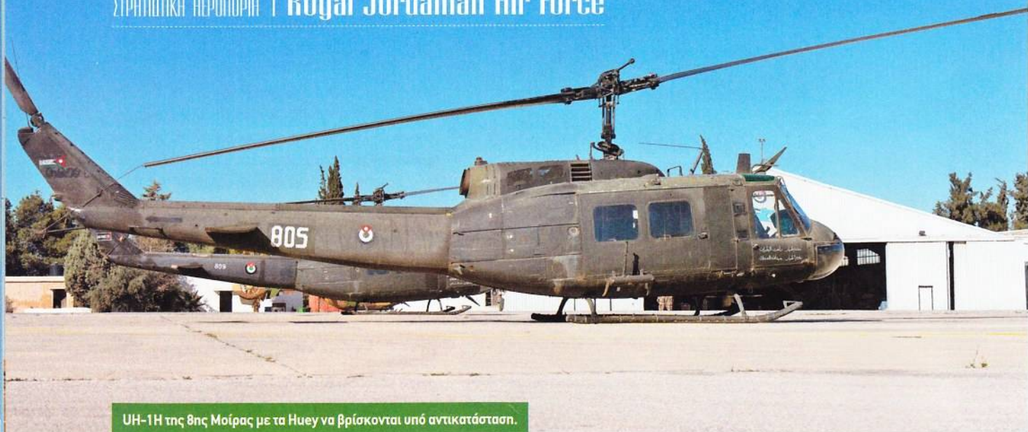
UH-1H της 8ης Μοίρας με τα Huey να βρίσκονται υπό αντικατάσταση.

για βοήθ σύγχρονων εκδόσεων Sidewinder και AGM-65D. Οι παραδόσεις των εκσυγχρονισμένων αεροσκαφών ξεκίνησαν το 1989 και διήρκεσαν τα πρώτα χρόνια της δεκαετίας του 90, αν και το 1994 η RJAF πούλησε στη Σιγκαπούρη επτά από τα (μη εκσυγχρονισμένα ακόμη) F-5E, προκειμένου να συνεχίσει τη χρηματοδότηση του προγράμματος. Ο στόλος των Tiger II μειώθηκε και πάλι το 2008, όταν δεκατρία F-5E και δύο F-5F πουλήθηκαν στην Κένυα, συμφωνία που περιλάμβανε επίσης την πώληση αποθεμάτων ανταλλακτικών και την εκπαίδευση χειριστών και τεχνικών. Το 2009 υπήρξε νέα «αφαίμαξη», όταν οκτώ F-5E και τρία F-5F κατέληξαν στη Βραζιλία προκειμένου να ενταχθούν στο πρόγραμμα F-5BR της Força Aerea Brasileira .