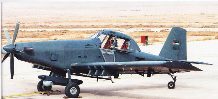
Ένα από τα πιο πρόσφατα αποκτήματα της RJAF: A-802 της 15ης Μοίρας. Διακρίνεται το ατρακτίδιο αισθητήρα MX15Di για την πρόσκτηση στόχων.