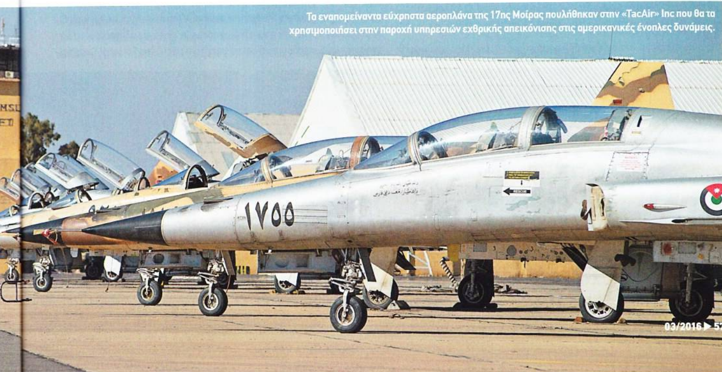
Τα εναπομείναντα εύχρηστα αεροπλάνα της 17ης Μοίρας πουλήθηκαν στην «TasAir» Inc που θα τα χρησιμοποιήσει στην παροχή υπηρεσιών εκθροικής απεικόνισης στις αμερικανικές ένοπλες δυνάμεις.

Η Royal Jordanian Air Force στα μέσα της δεκαετίας του 80 ανέθεσε στη βρετανική Smiths Industries των εκουγχρονισμό των Tiger II με το σχετικό συμβόλαιο να καλύπτει την τοποθέτηση νέου υπολογιστή αποστολής, HUD, ραδιοψομέτρου και INS με γυροσκόπια δακτυλίων λείζερ. Τα μαχητικά εξοπλήστηκαν επίσης με ατρακτίδια ECM ALQ-234, RWR και διανομείς αναλωσίμων ΗΠ της Selenia και επιπλέον πιστοποιήθηκαν