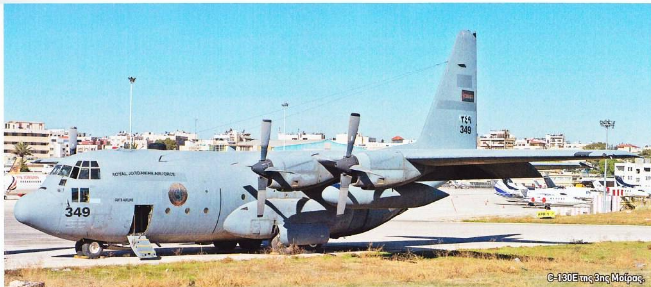
C-130E της 3ης Μοίρας.