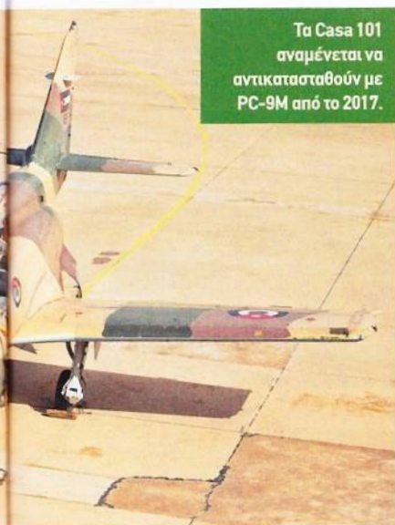
Τα Casa 101 αναμένεται να αντικατασταθούν με PC-9M από το 2017.

Ο έλεγχος των συνόρων και η επιτήρηση των παραμεθωρίων περιοχών