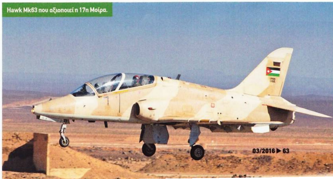
Hawk Mk63 που αξιοποιεί η 17η Μοίρα.