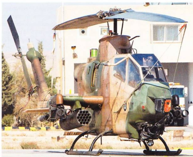
Η RJAF στοχεύει στον εκσυγχρονισμό 36 Cobra.

ter S-100 (από τα 12 που είχαν παραγγελθεί, αριθμός που έχει απομειωθεί από δύο απώλειες) και τέσσερα Finmeccanica Falco . Η ιταλική κοινοπραξία αναπτύσσει το νέο Falco EVO, που θα έχει και δυνατότητα μεταφοράς όπλων, ένα κοινό πρόγραμμα της ιταλικής και ιορδανικής αεροπορίας με προοπτική προμήθειας του τύπου και από τις δύο. Η κρίσιμη διαδικασία αξιολόγησης του αποτελέσματος αποστολών διεξάγεται σήμερα από μέσα συμμαχιών αεροποριών. « Η Ιορδανία αναζητούσε την ανάπτυξη της δικής της δυνατότητας ISR και μη επανδρωμένης κρούσης », μάς αναφέρει ο αντιπύραρχος Aljoubour ο οποίος συνεχίζει, « αυτό που αναζητούμε βέβαια βρίσκεται στο επίπεδο των Predator, το οποίο και έχουμε ζητήσει. Πιστεύω όμως ότι οι Ηνωμένες Πολιτείες δεν πρόκειται να το αποδεσμεύσουν σύντομα, αν και έχουν δείξει κάποιες προθέσεις για τη μελλοντική πώληση μιας πλατφόρμας ISR, όχι όμως οπλισμένης ». Η ενδιαφέρουσα εξέλιξη βέβαια είναι ότι η RJAF, για να καλύψει αυτές τις ανάγκες της και προ της άρνησης της Ουάσινγκτον να τις ικανοποιήσει, κατέφυγε στην Κίνα παραγγέλλοντας CH-4B Rainbow της CASC (China Aerospace Science & technology Corporation), κάτι που έχει επίσης κάνει και το Ιράκ. Τα CH-4B -λίγο μεγαλύτερα από τα Predator- έρχονται σε δύο εκδόσεις: το CH-4A, που είναι ένα Μη Επανδρωμένο Αερόχημα με αυτονομία πτήσης 30-40 ωρών ή εμβέλεια 3.500-5.000 χιλιομέτρων, και το CH-4B, που είναι το μοντέλο ένοπλης αναγνώρισης, το οποίο μπορεί σε 4-6 πυλώνες να μεταφέρει οπλικό φορτίο 250-345 κιλών. Έχει μέγιστο βάρος