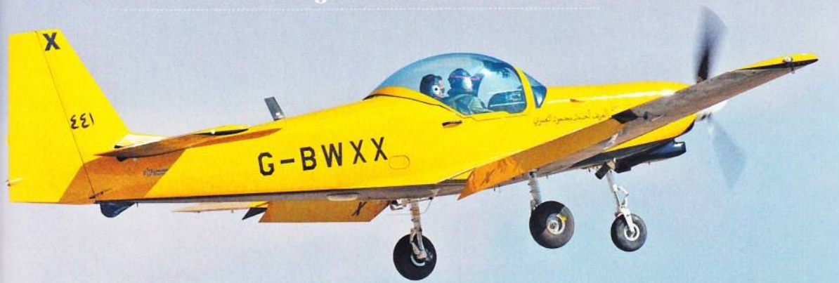
Τα κίτρινα T-67 Firefly είναι αυτά της δεύτερης παρτίδας που χρησιμοποιούνται κυρίως στη διαδικασία IP. Προσέξτε το «διπλό» νπολόγιο.