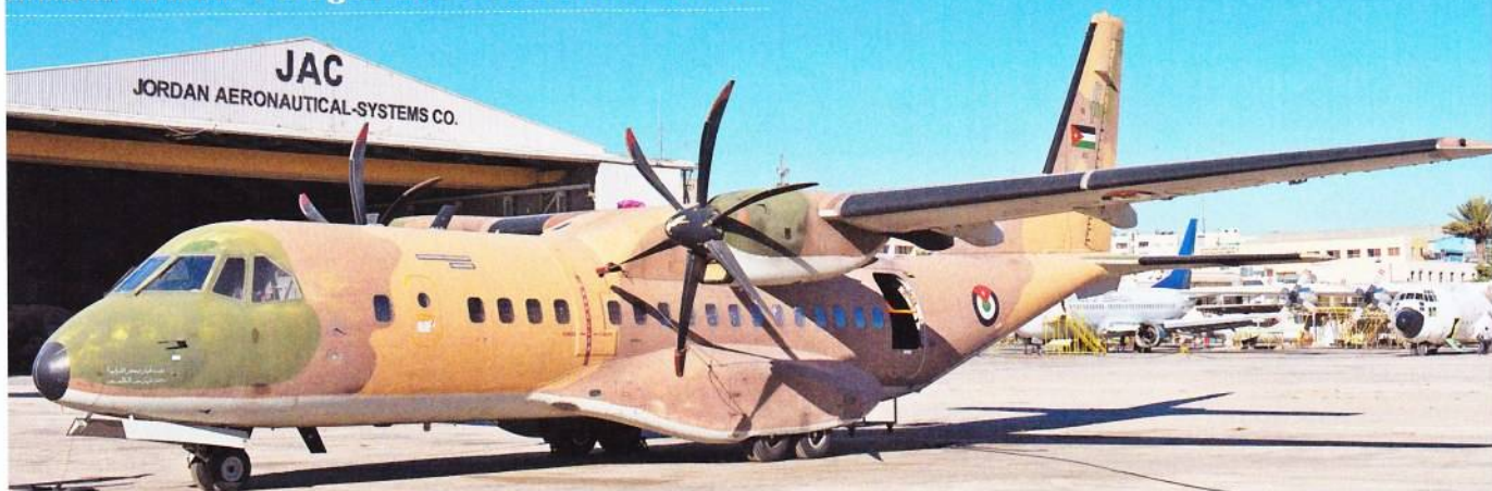
Η RJAF χρησιμοποιεί τόσο C295 όσο και gunship AC235.

αποτελούσε πάντα υψηλή προτεραιότητα για τις ιορδανικές ένοπλες δυνάμεις λόγω της γειτνίασης με χώρες όπου επικρατεί αστάθεια, όπως το Ιράκ και η Συρία, και φυσικά λόγω της παρουσίας εκεί τζιχαντιστών. Ο αεροπορικός στόλος με τέτοια καθήκοντα περιλαμβάνει έξι Cessna 208B Grand Caravan ως πηλατόφωμες ISR που συνεργάζονται με τα AT-802, δύο Airbus AC235 και τα S-100 Camcopter.