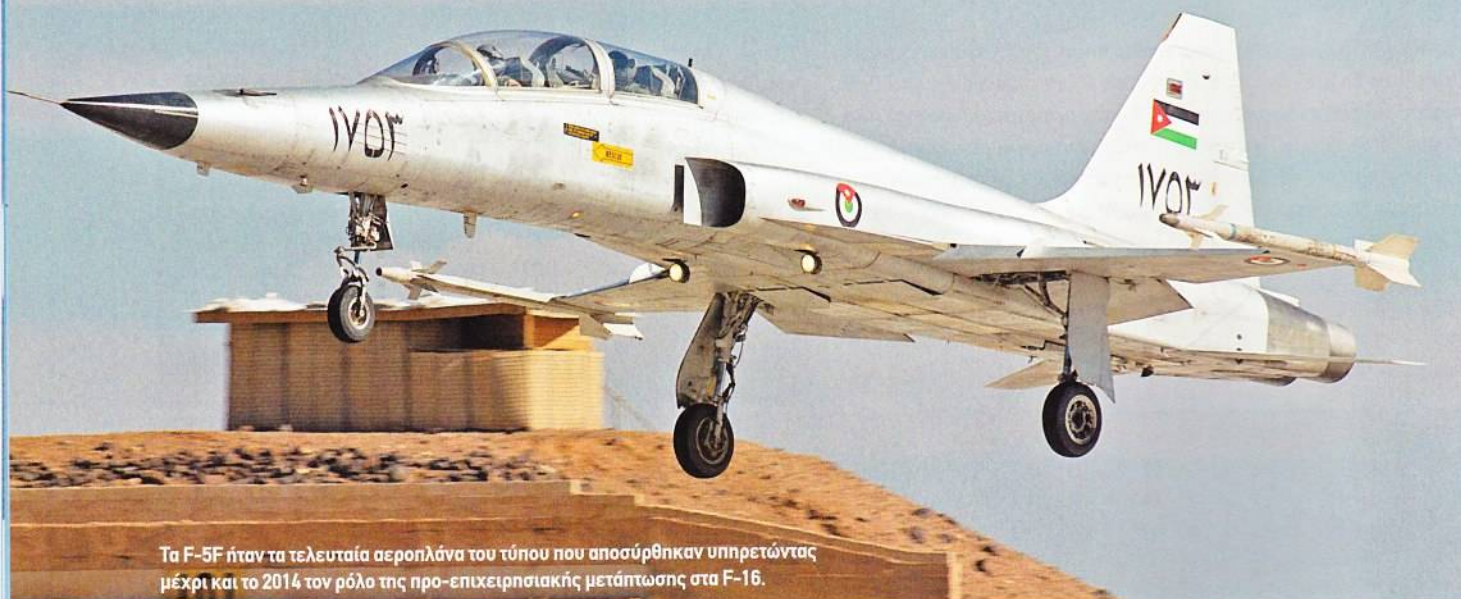
Τα F-5F ήταν τα τελευταία αεροπλάνα του τύπου που αποσύρθηκαν υπηρετώντας μέχρι και το 2014 τον ρόλο της προ-επιχειρησιακής μετάπτωσης στα F-16.