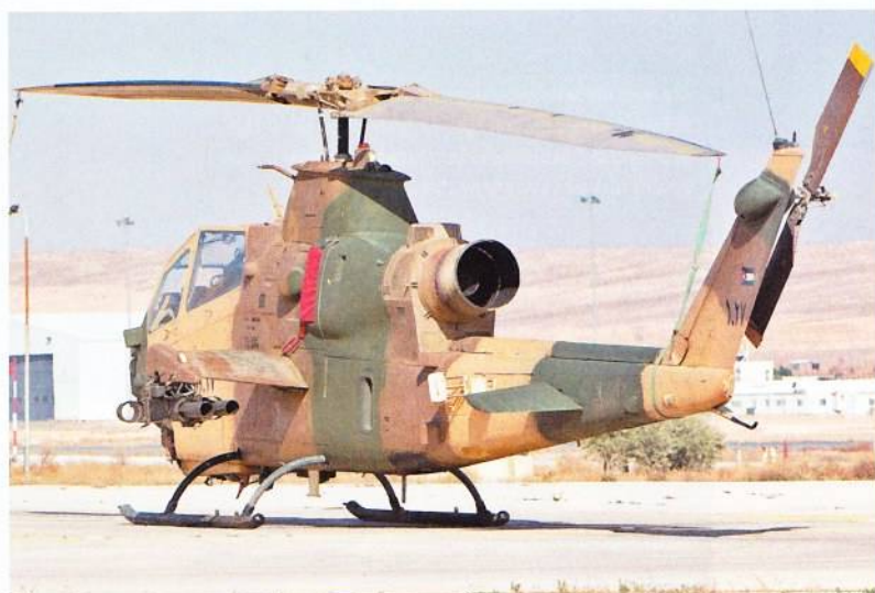
Δεκαέξι πρώην ισραηλινά AH-1E/F φέρονται να παραδοθούν στην Ιορδανία στο πλαίσιο της κλιμακούμενης συνεργασίας ασφάλειας των δύο χωρών.