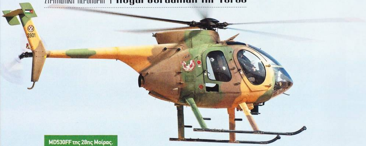
MD530FF της 28ης Μοίρας.

Το σύνολο της αεροπορικής εκπαίδευσης της RJAF συμπεριλαμβανομένων και των αεροπορικών μέσων, βρίσκεται υπό εκσυγχρονισμό.