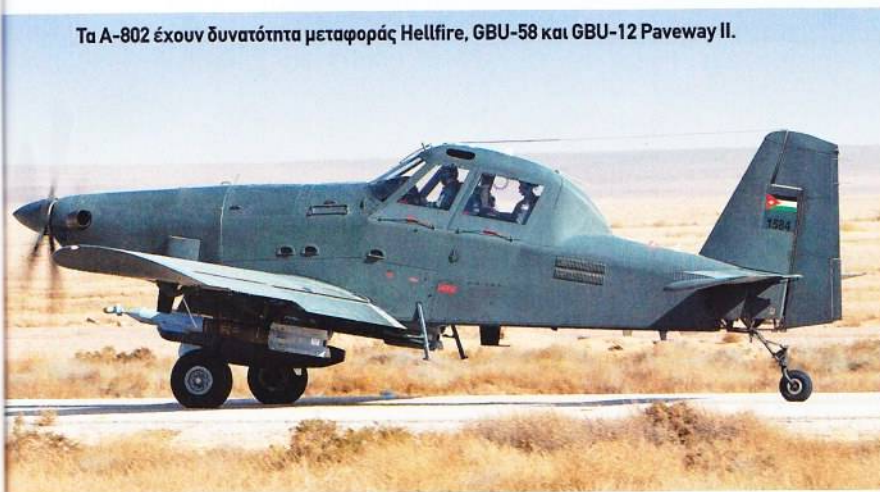
Τα A-802 έχουν δυνατότητα μεταφοράς Hellfire, GBU-58 και GBU-12 Paveway II.

αρνήθηκαν την πώληση McDonnell Douglas A-4 Skyhawk, το Αμμάν στράφηκε στη Γαλλία και επιχειρήσει να παραγγείλει Mirage F.1. Τα γαλλικά μαχητικά δεν αποκτήθηκαν τελικά σε εκείνη τη φάση, αλλά η προσπάθεια έπαιξε ρόλο στο να «πειστεί» η Ουάσινγκτον να αποδεσμεύσει F-5A/B. Η Ιορδανία βέβαια αγόρασε αργότερα με σαουδαρβική χρηματοδότηση 17 F.1CJ, 17 F.1EJ και δύο F.1BJ που παραδόθηκαν την περίοδο 1981-1983, αποκτώντας για τα πρώτα Matra Magic και Super 530, ενώ τα δεύτερα οπλήστηκαν με AS-30L.