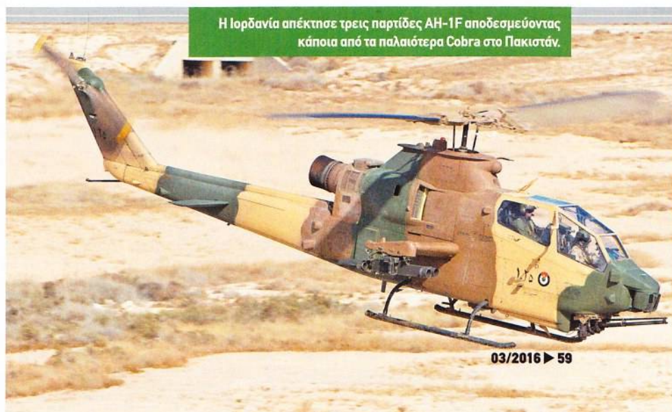
Η Ιορδανία απέκτησε τρεις παρτίδες AH-1F αποδεσμεύοντας κάποια από τα παλαιότερα Cobra στο Πακιστάν.