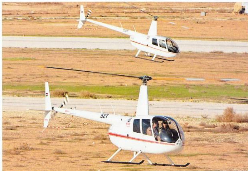
R44 Robinson της 5ης Μοίρας.

Για τη βασική εκπαίδευση χρησιμοποιούνται τα Slingsby T-67-M260 Firefly, 16 από τα οποία παραδόθηκαν την περίοδο 2002-2004 και η 4 η Μοίρα τα αξιοποιεί τόσο για την προετοιμασία νέων χειριστών όσο και στη διαδικασία IP (την προετοιμασία εκπαιδευτών). Στα αρχικά αεροπλάνα του τύπου προστέθηκαν και οκτώ που προήλθαν από τη RAF (Royal Air Force Defence Elementary Flying Training School) και αποδεσμεύθηκαν το 2011, όταν η στρατιωτική αεροπορική εκπαίδευση στο Ηνωμένο Βασίλειο «ιδιωτικοποιήθηκε» (ΠΙΔ No 348, «BAE Hawk T2, Εκπαιδευτικό άλμα για τη RAF»). Τα «βρετανικά» Firefly διαφέρουν από τα αρχικά «ιορδανικά» στο ότι δεν έχουν φίλτρο άμμου και κλιματισμό, ενώ είναι βαμμένα (προς το παρόν) και με δια-