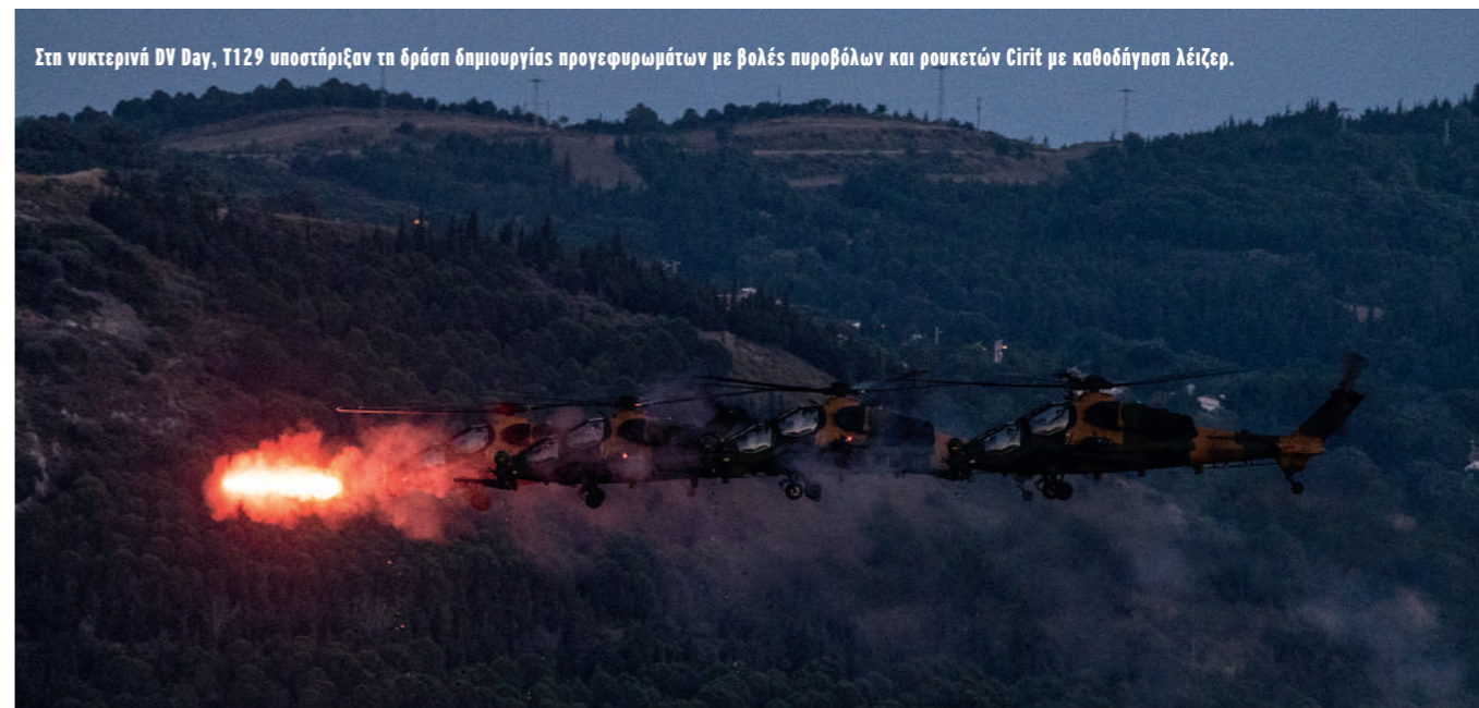
Στη νυκτερινή DV Day, T129 υποστήριξαν τη δράση δημιουργίας προγεφυρωμάτων με βολές πυροβόλων και ρουκετών Cirit με καθοδήγηση λέιζερ.

Η EFES 2022 έγινε εφαλτήριο επίδειξης ισχύος από την πολιτική ηγεσία της γειτονικής χώρας με πλήρη εκμετάλλευσή της από τον Τούρκο πρόεδρο Ρετζέπ Ταγίπ Ερντογάν, ενταγμένη στην επεκτεταμένη χρονικά προεκλογική εκστρατεία που διεξάγει όλο το 2022.