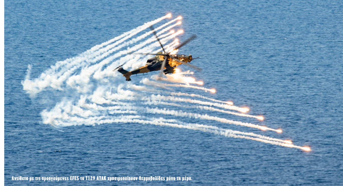
Αντίθετα με τις προηγούμενες EFES τα T129 ΑΤΑΚ χρησιμοποίησαν θερμολίδες μόνο τη μέρα.

και 193 Filo) αλλά και F-4E-2020 Terminator της 111 Filo, παρά το γεγονός ότι ο ρόλος των Phantom έχει υποβαθμιστεί και δεν ήταν παρόντα στην Anatolian Eagle 2022 τον Ιούνιο. Στη διάρκεια της ημερήσιας DV Day τα F-4E και τα Fighting Falcon πραγματοποίησαν προσβολές με πυροβόλα κατά στόχων στην ακτή, ενώ τρία από τα F-16 έριξαν JDAM GBU-31 των 2.000 λιβρών. Σε προσομοίωση ανεφοδιασμού αεροπρογεφυρωμάτων ένα C-130B Hercules του 222 Filo πραγματοποίησε ρίψη εφοδίων, ενώ CN235M-100 της 125 Filo επιχειρώντας από τη γειτονική AB Kaklic έριξε αλεξιπτωτιστές, οι οποίοι συγκροτούσαν ομάδες προκεχωρημένων παρα-