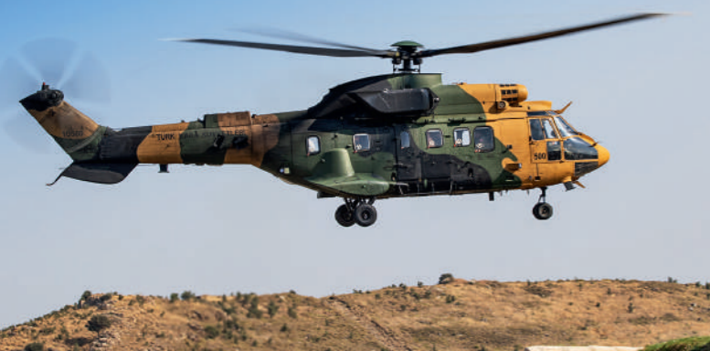
Η Αεροπορία των Τουρκικών Χερσαίων Δυνάμεων είχε την ογκωδέστερη συμμετοχή στην EFES 2022.