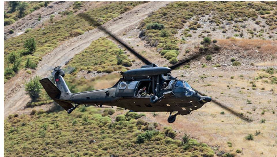
S-70A-28D «10057»/702493 του Özel Hava Grup