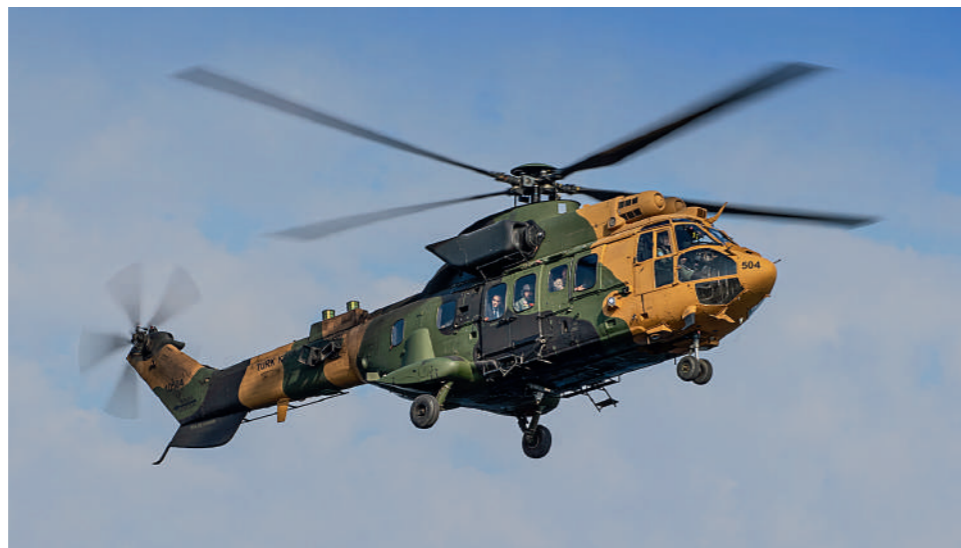
AS532UL πραγματοποίησαν πολλαπλές πτήσεις τις δυο DV Day για τη μεταφορά επισήμων και παρατηρητών στην άσκηση.