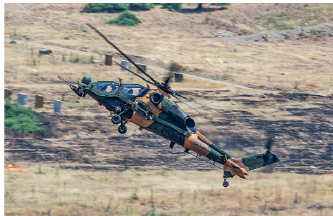
Το 3ο Σύνταγμα Αεροπορίας Στρατού ενταγμένο στη Στρατιά του Αιγαίου αναφέρει τα ΑΤΑΚ ως T129N, υπονοώντας τις επιχειρήσεις τους σε ναυτικό περιβάλλον.