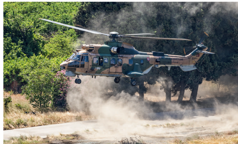
Cougar της Τουρκικής Αεροπορίας υλοποίησαν CSAR με την υποστήριξη T129 ATAK.