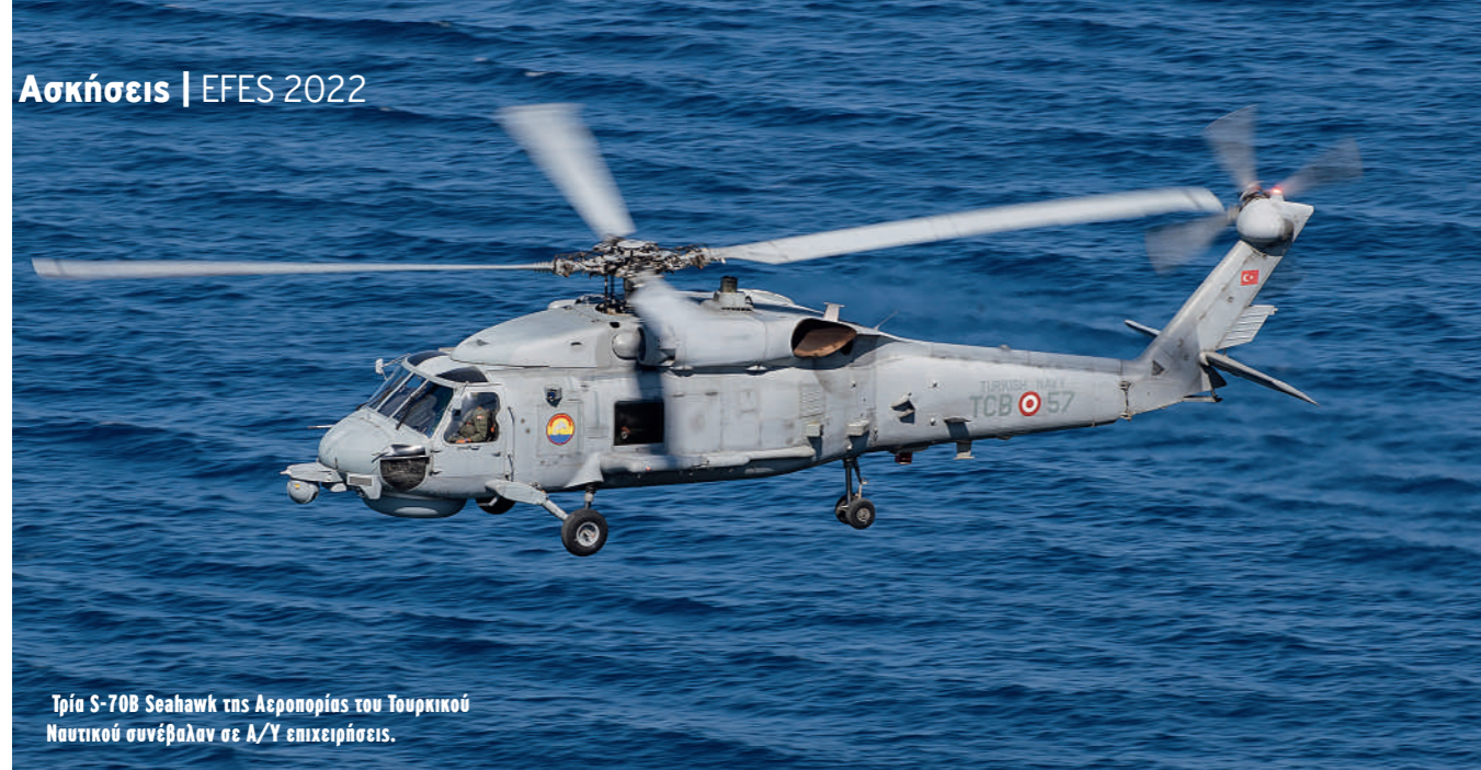
Τρία S-70B Seahawk της Αεροπορίας του Τουρκικού Ναυτικού συνέβαλαν σε Α/Υ επιχειρήσεις.

Ένα από τα τέσσερα ATR72-600MPA που έχει παραλάβει μέχρι στιγμής το τουρκικό ναυτικό (από τα έξι σε παραγγελία) υπό διαμόρφωση ASW στο πλαίσιο του προγράμματος MELTEM III.