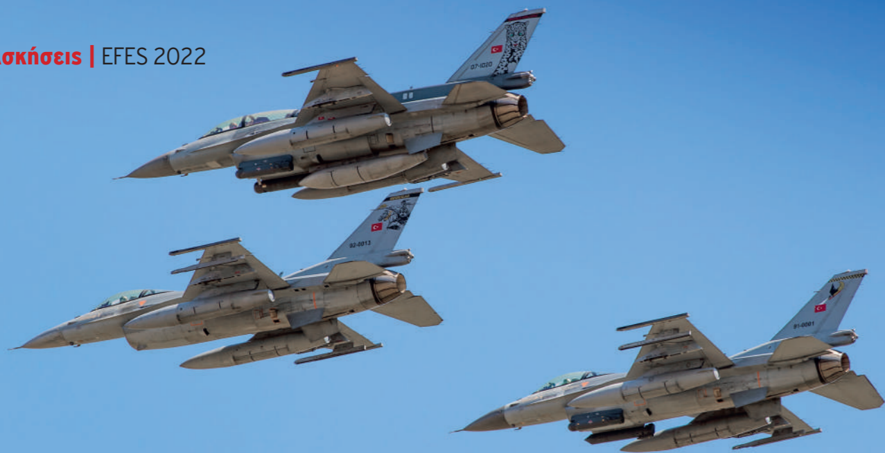
Σχηματισμός F-16C από διαφορετικές Μοίρες που επιχειρούν από την Bandırma. Το ένα προέρχεται από την 162 Filo, που ανασυγκροτήθηκε μετά τη διάλυσή της σε συνέχεια του αποτυχημένου πραξικοπήματος του Ιουλίου 2016.