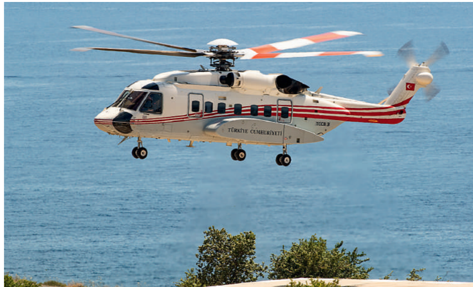
Το προεδρικό S-92A, που επιχειρεί με τον βραχίονα εναέριων μέσων της τουρκικής αστυνομίας, φτάνει στον χώρο της άσκησης.

Με την ογκώδη διεθνή συμμετοχή και τον μεγάλο αριθμό παρατηρητών και ΜΜΕ από πολλές χώρες, η EFES 2022 ήταν μια μεγάλη ευκαιρία επίδειξης όχι μόνο των τουρκικών ενόπλων δυνάμεων αλλά και της τουρκικής πολεμικής βιομηχανίας. Ανάμεσα στις πολλές παρουσίες να σημειώσουμε αυτή ενός MEAM (τουρκιστί TIHA-Taarruz İnsansız Hava Araçları) Bayraktar Akinci του 3 ου Τάγματος Μη Επανδρωμένων Αεροχημάτων (3 ncü Ordu İnsansız Hava Araçları Sistemleri Tabur). Το αεροσκάφος, σύμφωνα με τα όσα ανακοινώθηκαν, απογειώθηκε από την έδρα του στην Batman, βαθιά στην Ανατολία, στις 03:20 και πραγματοποίησε προσβολή στόχου στην περιοχή της απόβασης το μεσημέρι με «έξυπνο» μικρο-πυρομαχικό MAM-L της Roketsan, επιστρέ-