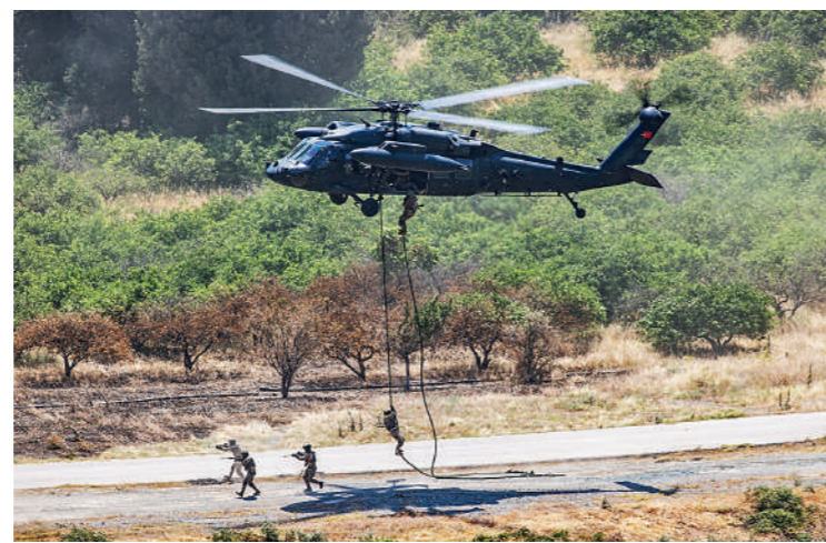
S-70A «Yarasa» («Νυκτερίδα») της διοίκησης δυνάμεων ειδικών επιχειρήσεων, που πρωταγωνίστησαν τόσο στη νυκτερινή όσο και την ημερήσια επίδειξη.