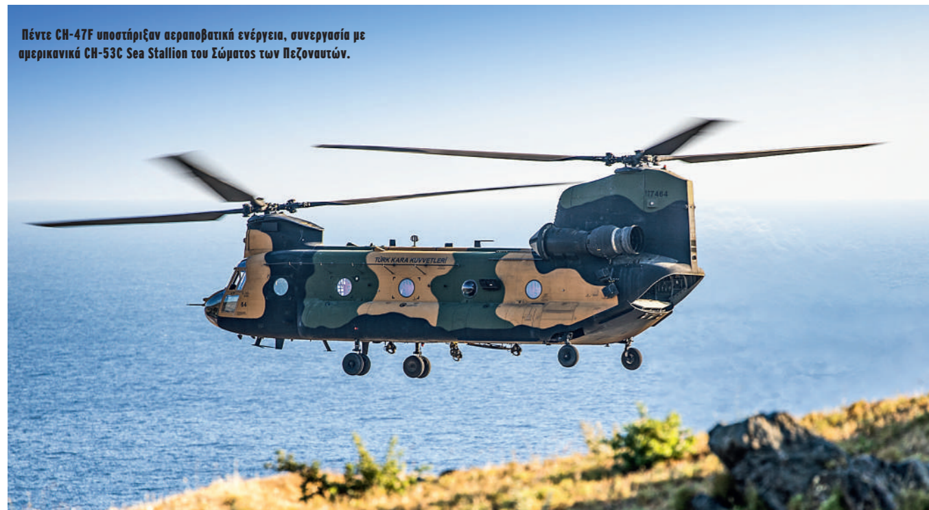
Πέντε CH-47F υποστήριξαν αεροπορική ενέργεια, συνεργασία με αμερικανικά CH-53C Sea Stallion του Σώματος των Πεζοναυτών.