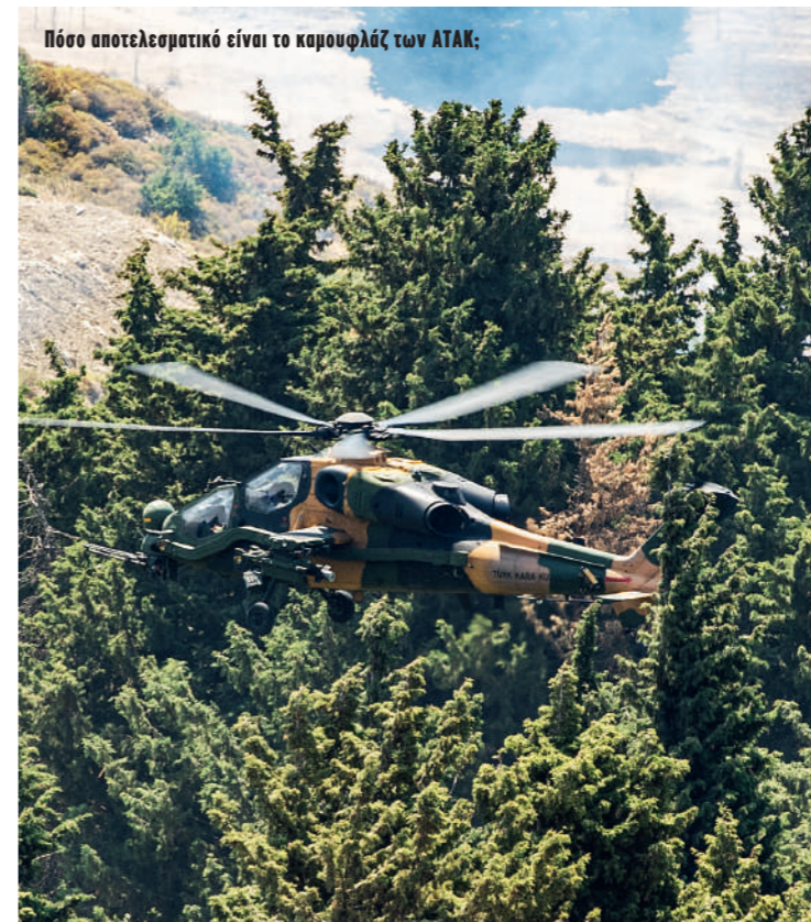
Πόσο αποτελεσματικό είναι το καμουφλάζ των ΑΤΑΚ;

Η φετινή έκδοση της διακλαδικής άσκησης με πραγματικά πυρά EFES 2022 ήταν μια από τις μεγαλύτερες στην ιστορία της και οι πολλαπλές φάσεις της εξελίχθηκαν από τις 9 Μαΐου έως τις 9 Ιουνίου.